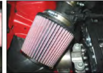
Fig. # 16