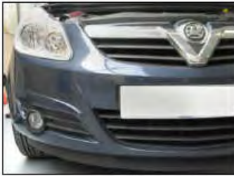
Fig. # 17