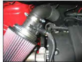
Fig. # 19