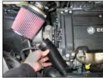
Fig. # 18