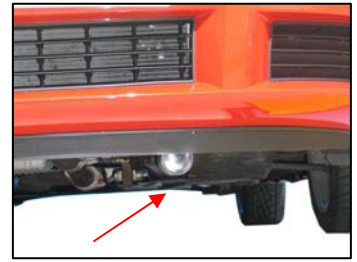
Fig. # 15