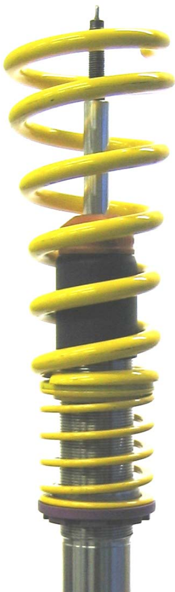
Angeliefertes Federbein. Supplied coilover strut.

Stützlager vom Serienfahrzeug auf den angelieferten Dämpfer montieren. Das Anzugsdrehmoment der Kolbenstangenbefestigung beträgt 35 Nm. Die Montagehinweise zum Einbau des Federbeines in das Fahrzeug, sowie die Anzugsdrehmomente der Federbeinbefestigung, entnehmen Sie bitte den Unterlagen des Fahrzeugherstellers.