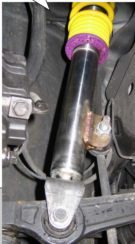
Montiertes Federbein. Installed coilover strut.

Mount the supporting bearing of the production car on the supplied shock absorber. Tightening torque for the piston rod is 35 Nm (26 ft-lb). Please install the strut unit to manufacturers recommended settings regarding tightening torque and fixing specifications.