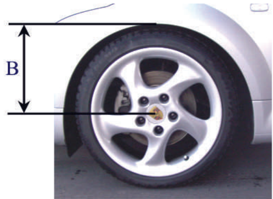
Measurement B Wheel hub center wheel arch

Please enter the adjusted height of the modified car into the list: